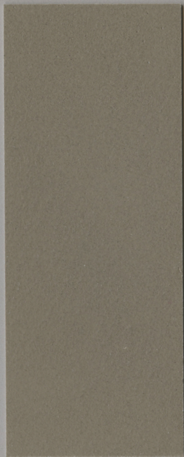
CONTINUO C600 / TOP GLOSSY