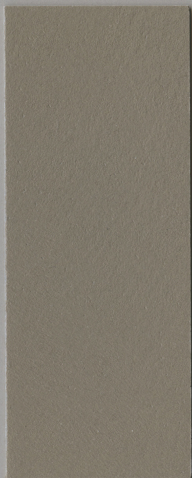
CONTINUO C600 / TOP SATIN/ TOP ART SATIN