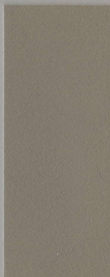
CONTINUO C600 / TOP ART MAT